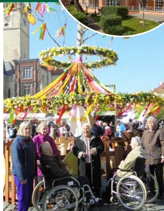
Naše výprava na velikonočním trhu ochutnala tradiční dobrotu a prohlédla si nově zrekonstruovaný Orloj

Velikonoce jsme završili klasickou velikonoční nadílkou.