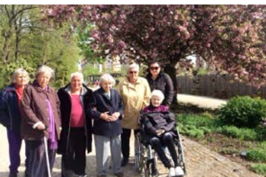
Botanická zahrada v Tróji nás naprosto ohromila

S našimi klienty z Roztok jsme se vypravili poznávat exotické skvosty tropických deštných pralesů, vysokohorského mlžného lesa i nejsušších oblastí světa. A nemuseli jsme cestovat nikam daleko. Botanická zahrada v Tróji je malým kouskem ráje ve víru velkoměsta.