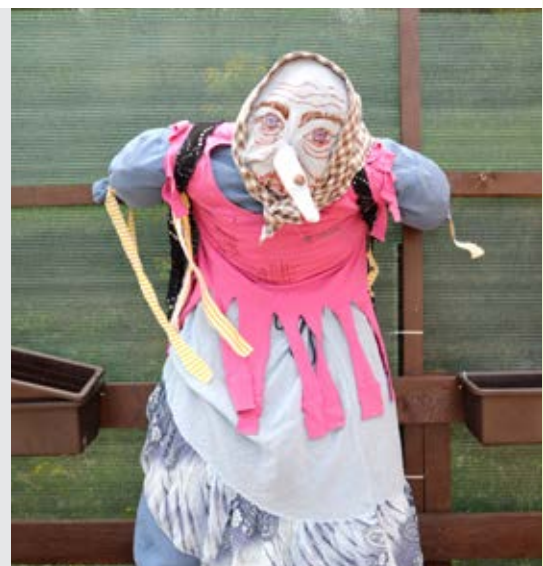
Takovouto Čarodějnicí si vyrobili naši klienti s aktivizačními pracovníky

tové, kteří se tím loučili se zimou a vítali jaro. Právě oheň byl pro lidi dříve hlavně magickou silou, kterou uctívali slunečního boha. Zároveň tato noc odpradávná patří oslavě života a lásky. A takovou jsme ji oslavili i u nás v Roztokách. Počasí se umoudřilo a po ranním dešti nás čekalo odpoledne plné slunce, které jsme strávili na terase při příjemné hudbě a dobrém jídle. Vrcholem odpoledne bylo samozřejmě opékání špekáčků.