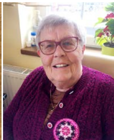
Tvoření mandal si užíváme a přináší nám velkou radost, každá je totiž jiná, tvořená z různých materiálů a každá je originální