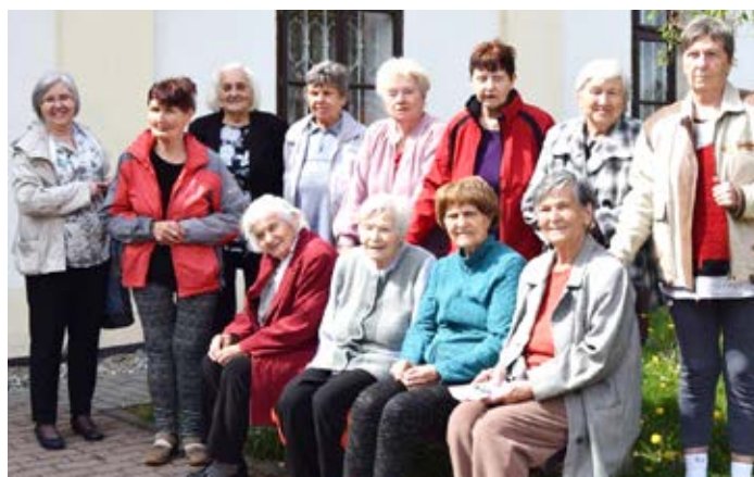
Na dubnový výlet jsme se vydali do Technického muzea v Petřvaldě